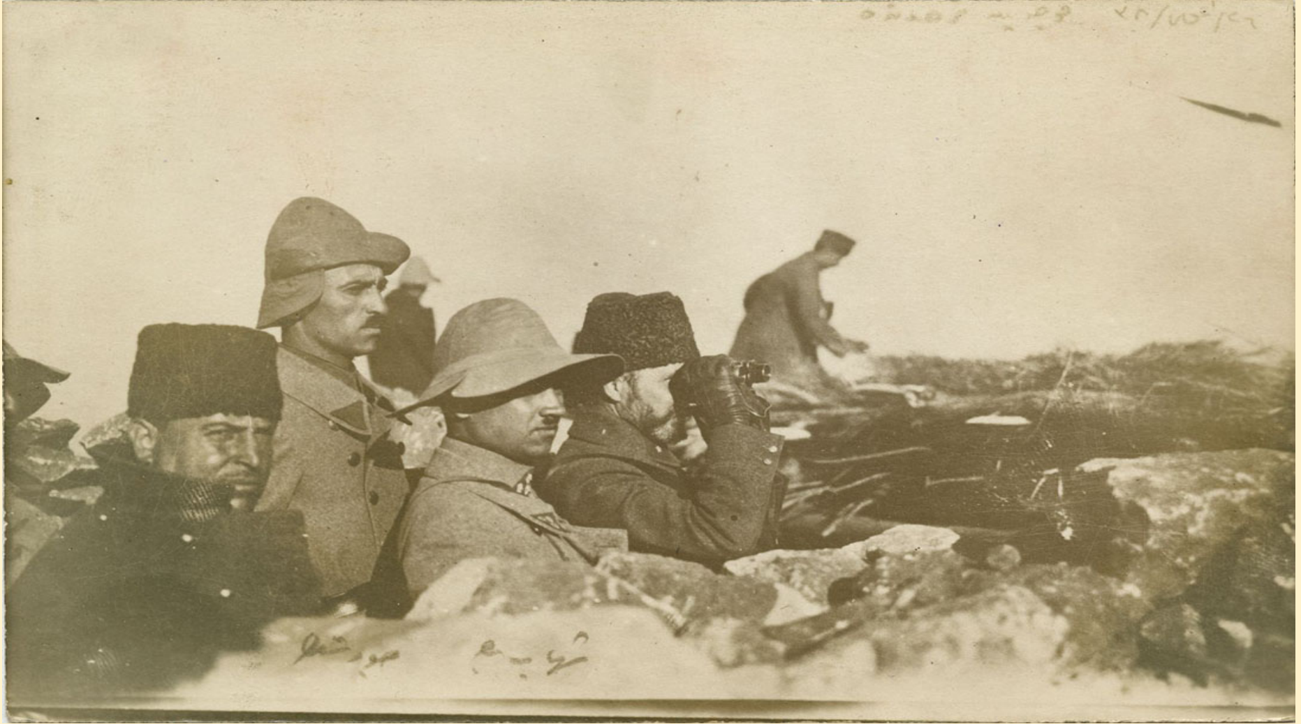
Milli Mücadele yıllarında Nurettin Paşa ve Türk askerleri