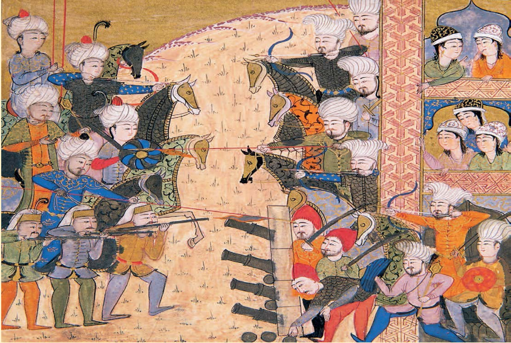
1517 Ridaniye Savaşı (Şükrî-i Bitlisî, Selîm-nâme/Fütûhât-ı Selîm Hân , vr. 235a)