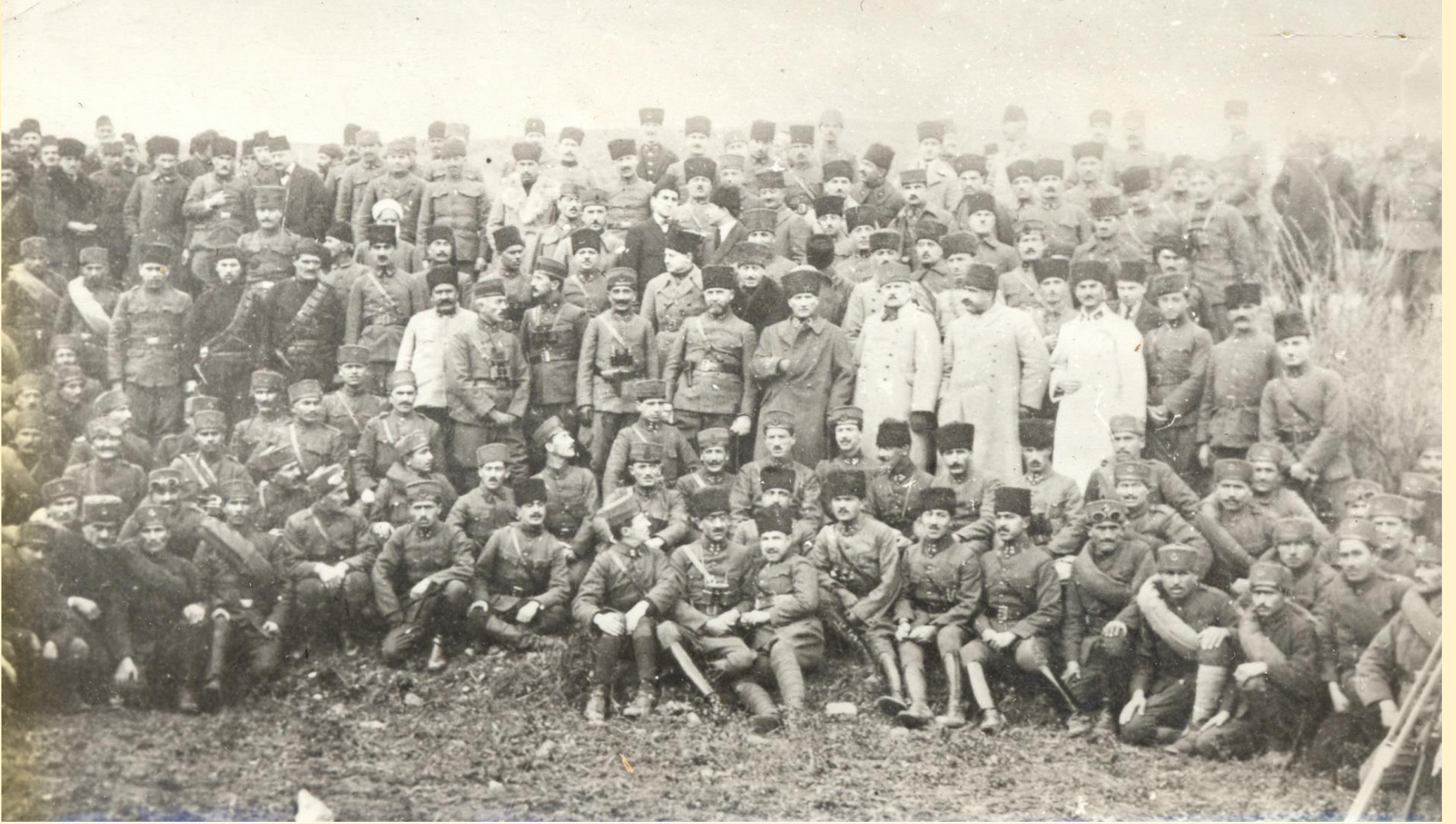
Başkomutan Mustafa Kemal Paşa Büyük Taarruz'da silah arkadaşları ve askerlerle birlikte (1922).