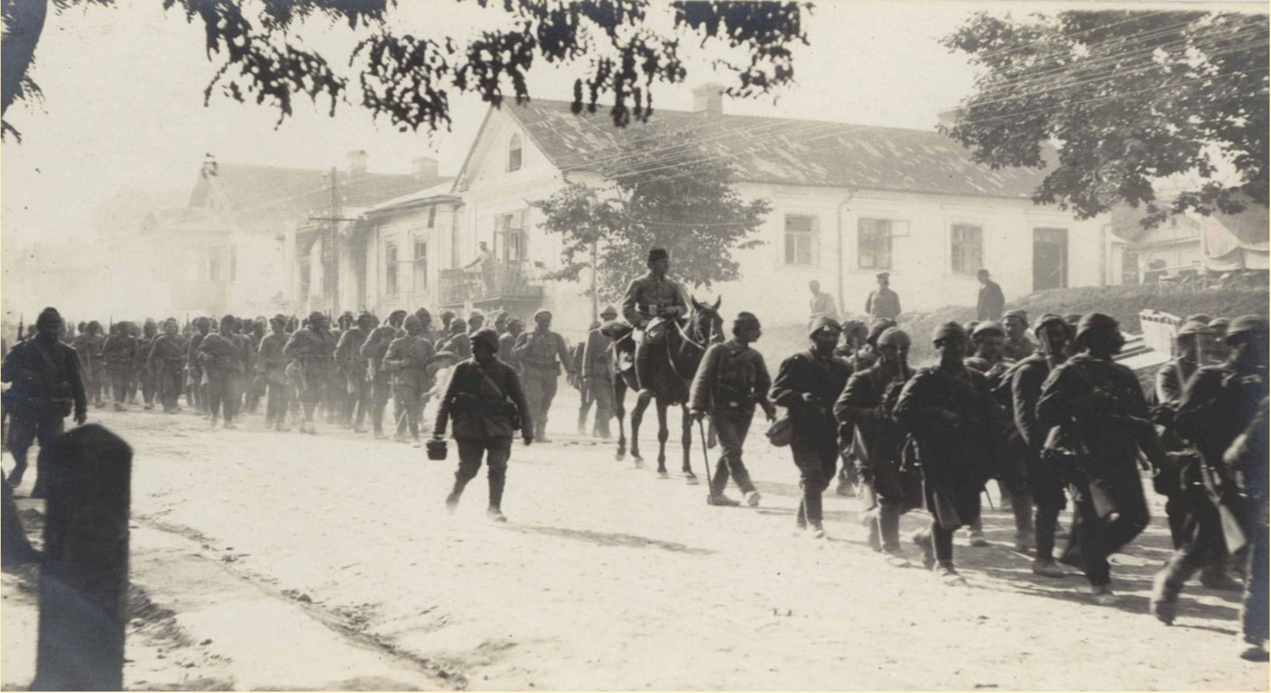
I. Dünya Savaşı yıllarında Galiçya Cephesi'nde Türk askerleri (İBB Atatürk Kitaplığı, Krt_013216)